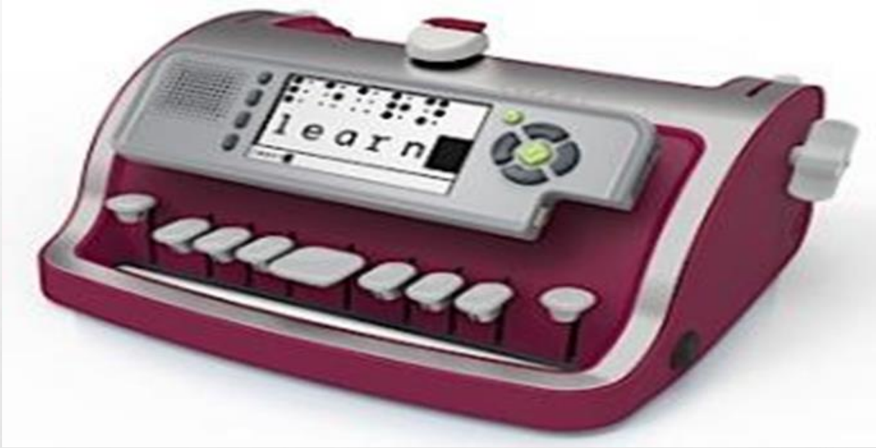
آلة بركنز الكاتبة